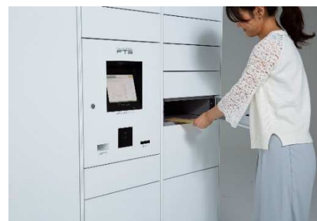
フルタイムロッカー

フルタイムシステムは、世界に先駆け「宅配ボックス」「宅配ロッカー」(フルタイムロッカー)を開発し、集合住宅を中心に戸建住宅、オフィス、駅などへの設置件数 37,000 棟を超える宅配ボックス・宅配ロッカーを提供するリーディングカンパニーです。35 年以上にわたりお客様の声に耳を傾け、宅配ボックス・宅配ロッカーと 24 時間有人対応のコントロールセンターを核とし、レンタサイクル、カーシェアリング、EV 充電など、住生活を豊かにする設備やサービスを提供しています。今後も集合住宅のみならず、オフィス、オフィスビル、店舗、学校、公共施設など、あらゆるシーンでより快適な生活環境の創出と利便性の向上を目指します。