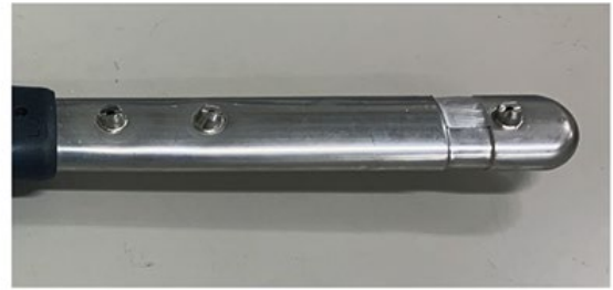
プレジェットウォッシャーの洗浄ノズル