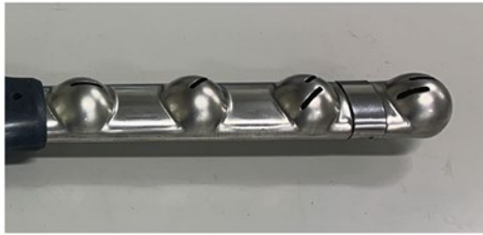
通常の洗浄ノズル

食器類に付着している残菜などをしっかり取り除くため本製品専用ノズルを開発しました。スプレー部の穴形状を見直すことで超高压噴射を実現しました。