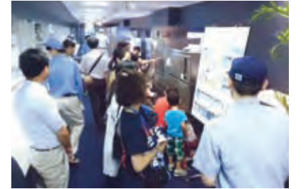
ファミリーデーの様子

また、管理職を対象に、360度評価を実施しています。本人を含め上司や部下など複数の評価を、自己評価と他者評価のギャップとしてフィードバックし、意識および行動改善を促す教育をおこなうことで、マネジメント力とコンプライアンス意識の向上につなげています。