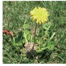
トウカイタンポポ